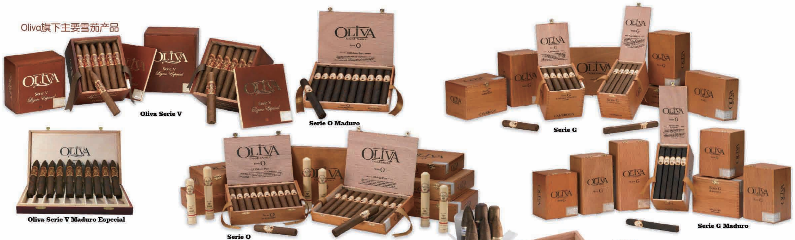
Oliva Serie V